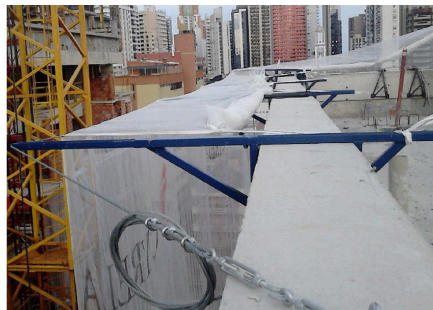
REF.: SUPORTE TELA FACHADEIRO ESCALA 1: SEM ESCALA