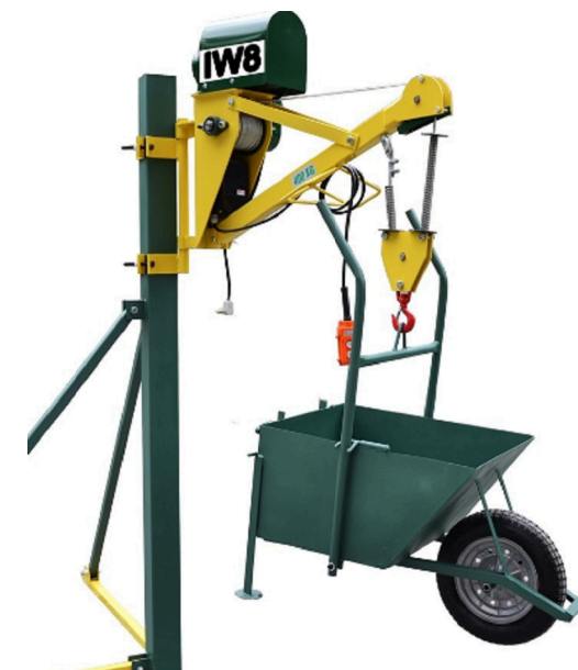
REF.: GUINCHO HIDRÁULICO ESCALA 1: SEM ESCALA